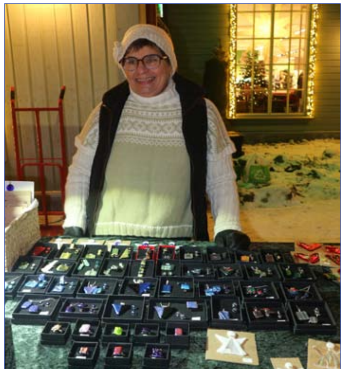
Julemarked i Næroset desember 2024.